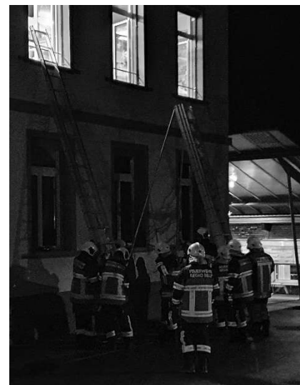
.....und in der Praxis

An den ersten Übungen der neuen Organisation war spürbar, dass die AdF der veränderten Situation gespannt, wie auch mit der besagten Skepsis entgegenblicken. Mit dem Wechsel zu der einheitlichen Schutzausrüstung ist der Zusammenschluss optisch erfolgt. Auch bei den bisherigen FW-Einsätzen im 2020 hat sich gezeigt, dass die Zusammenarbeit im Ernstfall bereits bestens funktioniert.