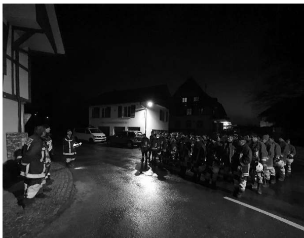
Einsatzelement Wald bereit zur Übung

Da die FW Wald bislang nicht mit Personalmangel zu kämpfen hat- te, brauchte es diesbezüglich viele Gespräche und Überzeu- gungsarbeit um die Vorteile die- ser neuen Organisation aufzu- zeigen. Für die FW Wald resp. die Gemeinden Wald und Nie- dermuhlern gaben strategische Überlegungen den Ausschlag um sich der FW Regio Belp anzu- schliessen. Die mittelfristige Be- setzung und die Belastung der Kaderpositionen sowie die Ta- gesverfügbarkeit und der mittler- weile sehr hohe Administrations- aufwand waren die kritischen Faktoren, welche es für die Zu- kunft sicherzustellen galt.