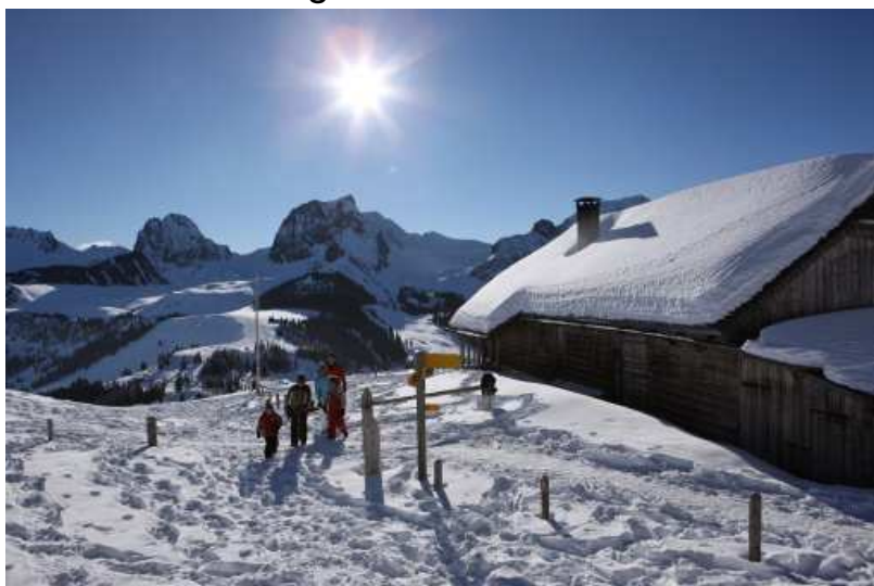
Schöne Winterlandschaften – der Naturpark Gantrisch

Weitere Kurse und Veranstaltungen finden sich auch unter www.gantrisch-outdoor.ch .