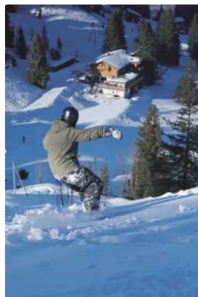
Mit Schwung zum nächsten Restaurant