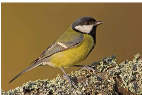
Kohlmeise schweiz. Vogelwarte

An zwei Anlässen können wir die Natur vor unserer Haustüre kennen lernen: Vorkenntnisse und Anmeldung sind nicht nötig. Erwachsene und Kinder sind herzlich willkommen.