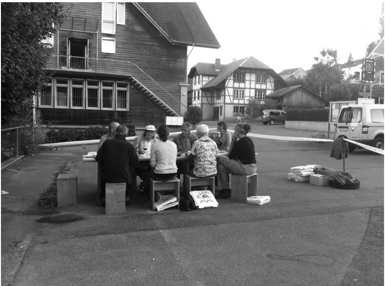
Pizzaessen der Arbeitsgruppe auf dem Dorfplatz

Wir sind überzeugt einen Platz mit Nachhaltigkeit geplant zu haben. Wir erwarten von der Bevölkerung die notwendige Unterstützung zum Bau des Dorfplatzes.